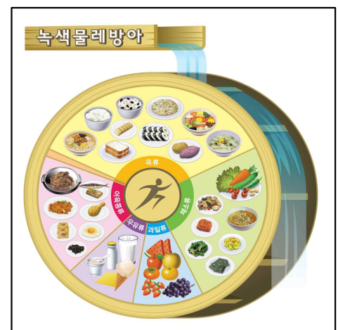
<녹색 물레방아 모형 (안) >